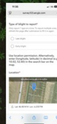
Application en ligne